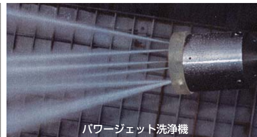
パワージェット洗浄機