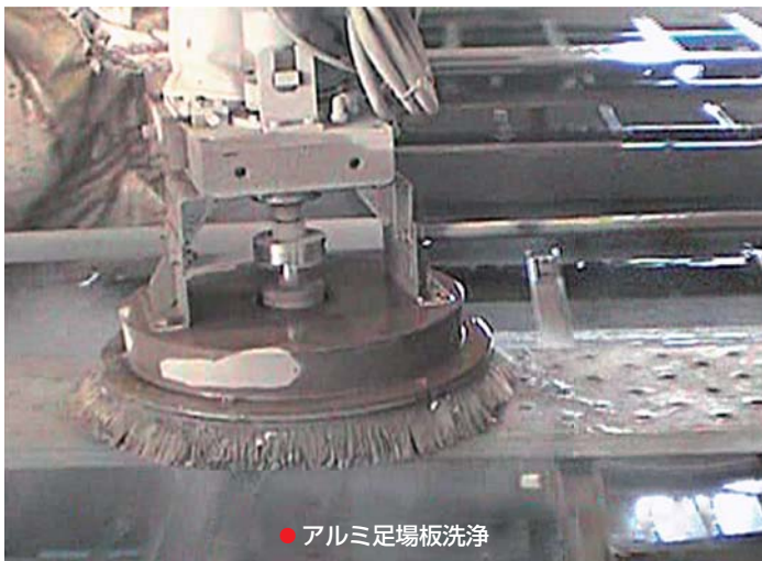
● アルミ足場板洗浄