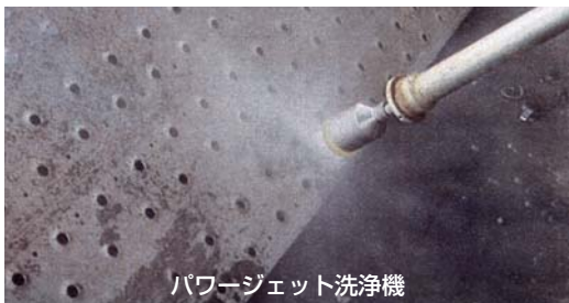
パワージェット洗浄機