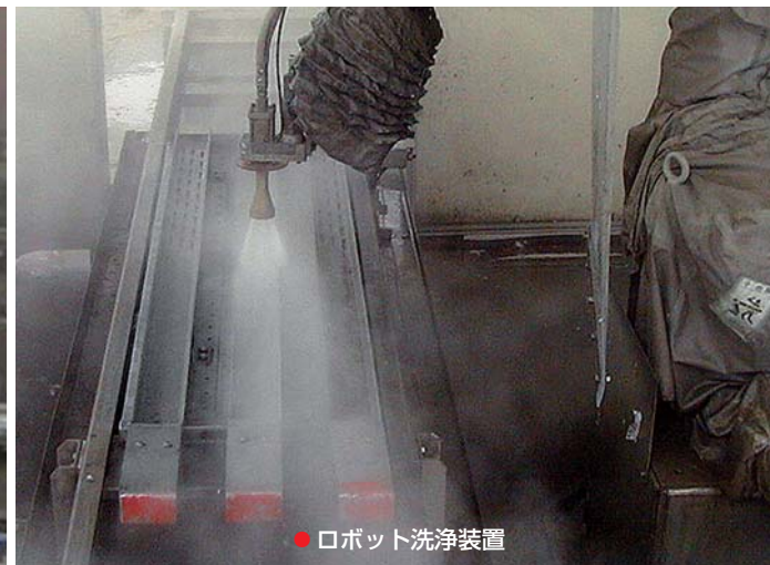
● ロボット洗浄装置