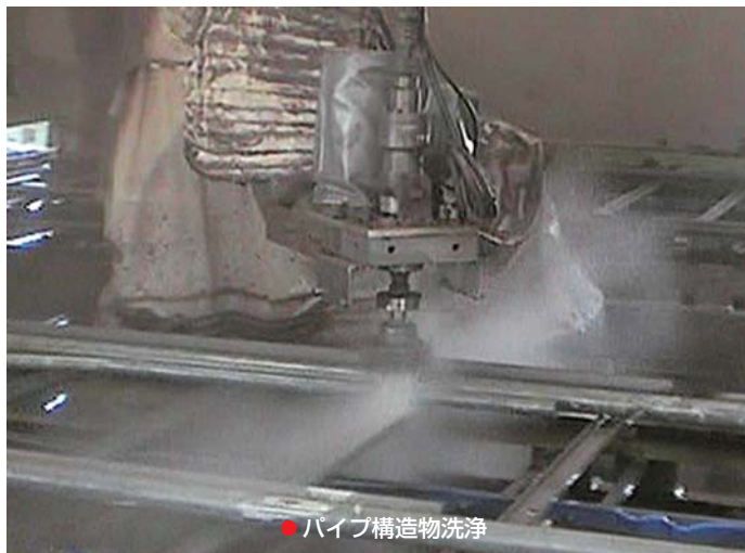
● パイプ構造物洗浄